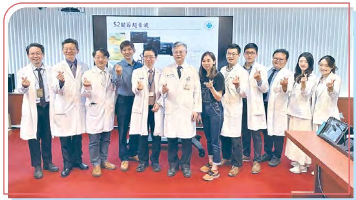
▲ 乾癬與乾癬性關節炎跨科團隊合照

我們也定期監測病人的頸動脈內膜厚度，提早發現動脈硬化，降低心血管疾病發病機率。呼籲患有乾癬的民眾，如有任何關節不適、手指腳趾腫、下背痛等，請務必諮詢您的照顧的皮膚科醫師，免或免疫風濕科醫師，進一步 X 光或關節超音波檢查，及早發現、及早治療。🌿